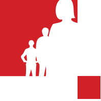
Prilog 1. Algoritam zdravstvenog nadzora nad kontaktima oboljele osobe